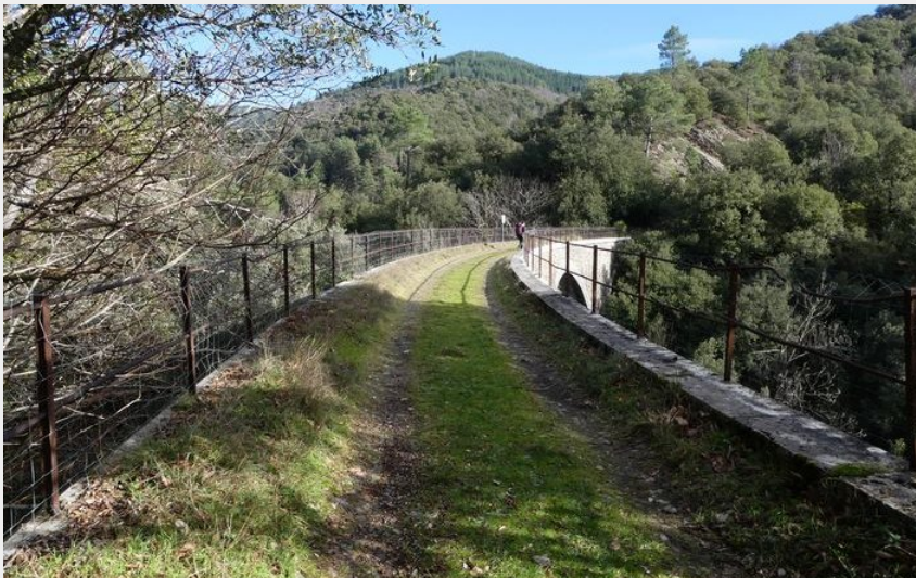
La voie ferrée (nathalie.thomas)