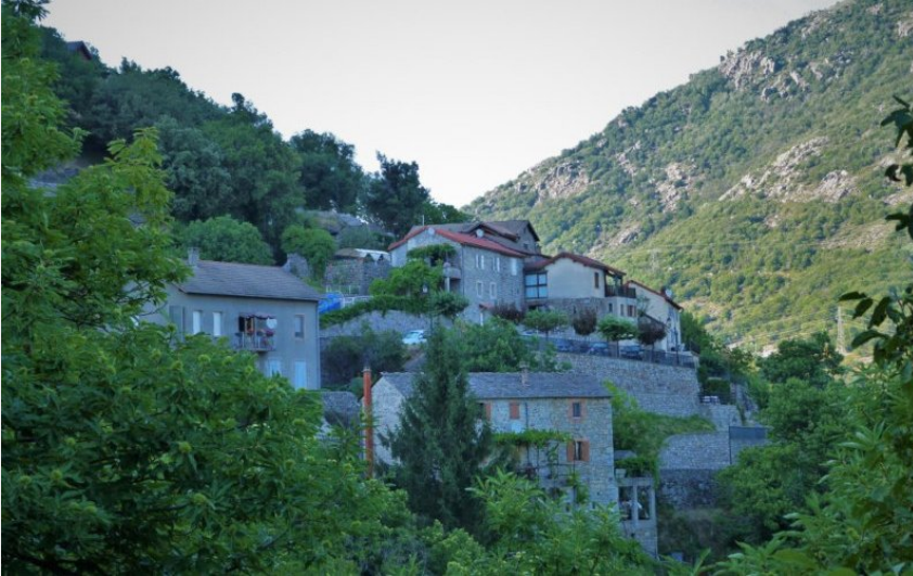
(OT Mont Lozère)