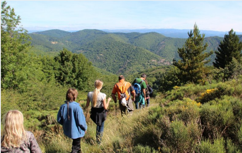
(Gites le Frontal Haut)