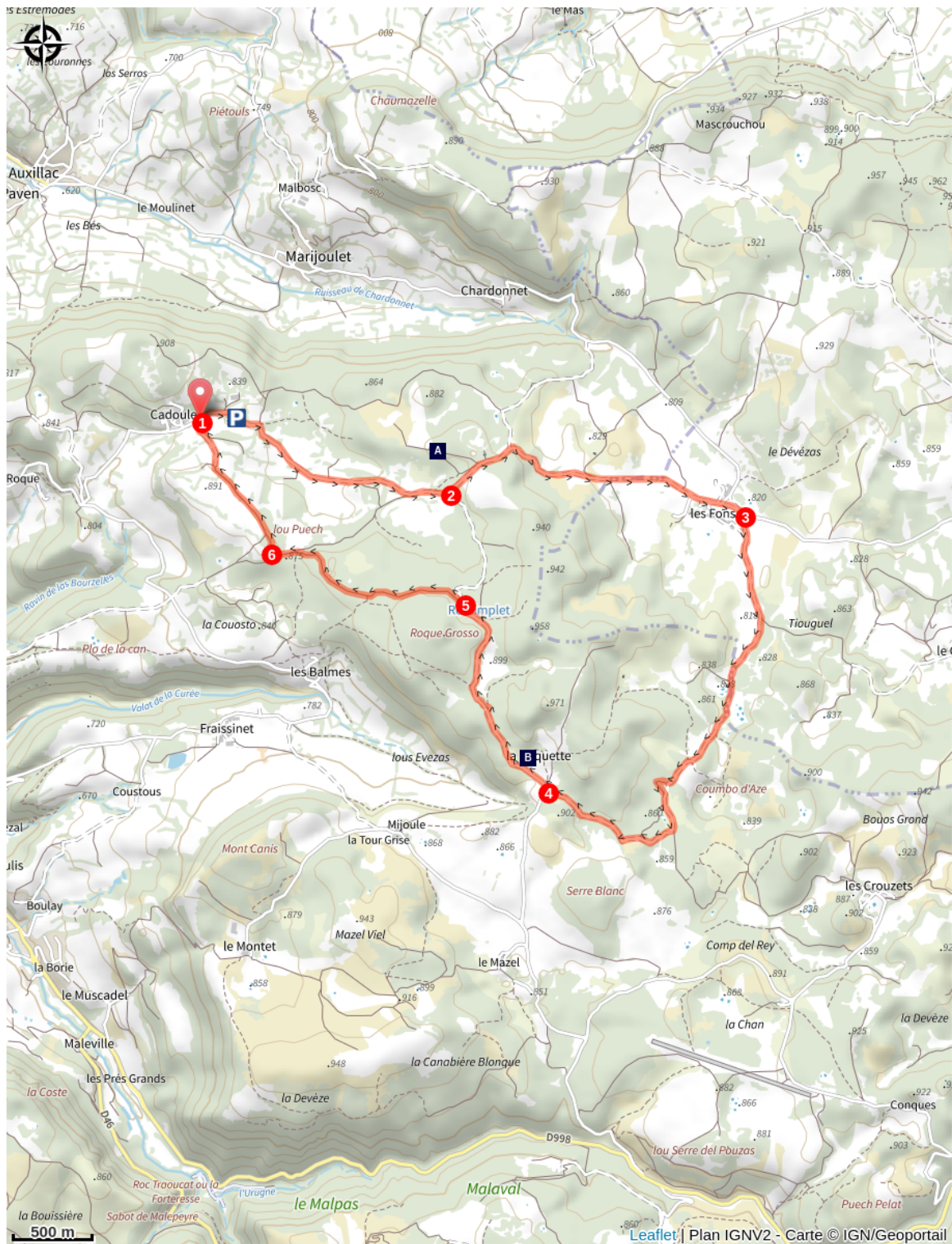
Dolmen de Chardonnet (A)