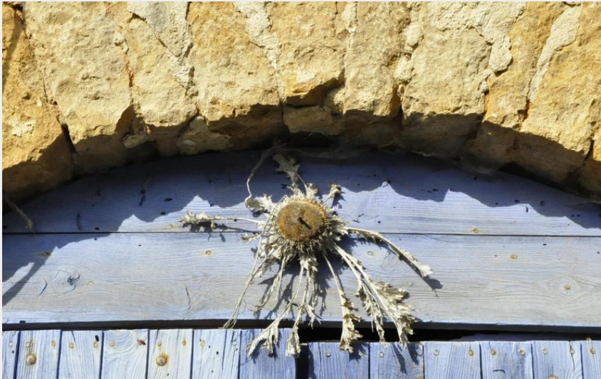
Chardon sur une porte