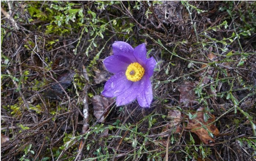
Anémone pulsatille