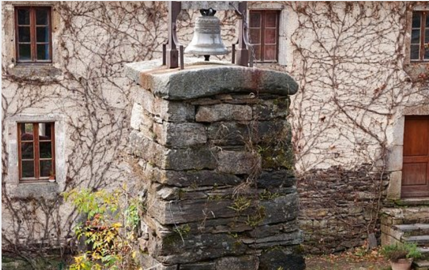
Clocher de tourmente d'Auriac