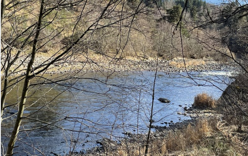
Les berges de l'Allier