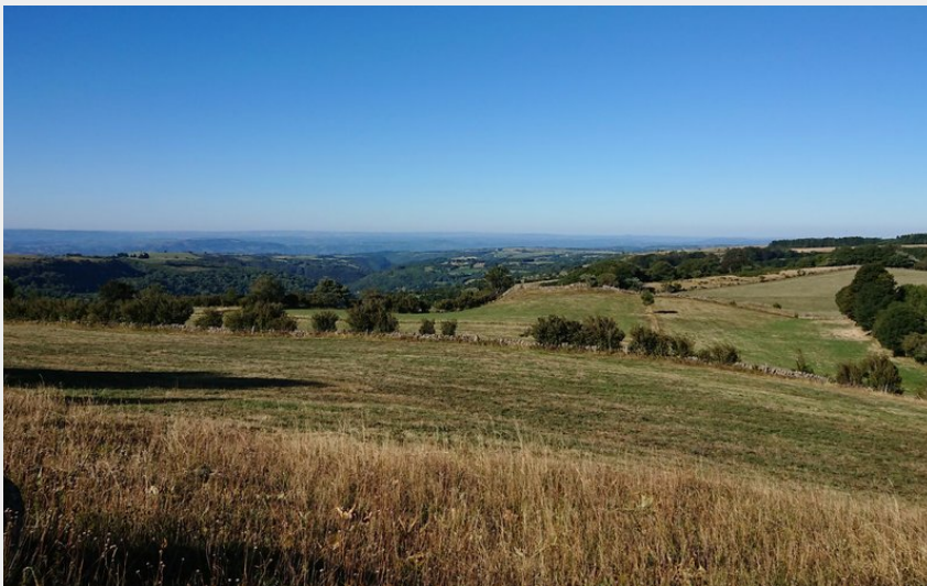
Les boraldes s'étirant vers la vallée du Lot